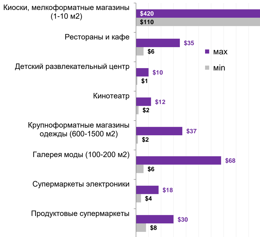
Фиксированные арендные ставки В ФЕВРАЛЕ 2022 без учета % РТО ($/м2/мес без НДС и ЭП)